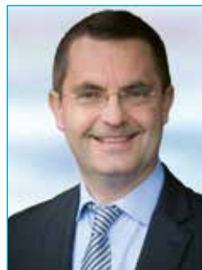
Dr. med. Dipl. Biol.

Chefarzt Facharzt für Psychiatrie und Psychotherapie Zusatzbezeichnung Suchtmedizinische Grundversorgung